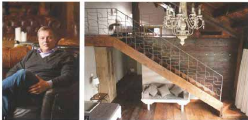
1 法国山堡的男主角马克夫，喜欢与客人聊天，中文讲得比你我还要好。(王蔚 摄) 2 现代的舒适和旧日的情怀，都藏在法国山堡的房间里——恰如其分。

寻觅他有一处可供他们（尤其是3个儿子）度假的圣地，从上海到南京、南通、湖州，甚至途中故意迷路……直到有一次开车经过德清县莫干山，遇到这片绿色的青山和茶园，让司徒夫和妻子一见倾心，几乎不费什么思考便立马决定“就是这里了”。